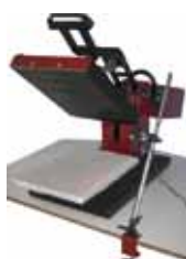
Support universel de table