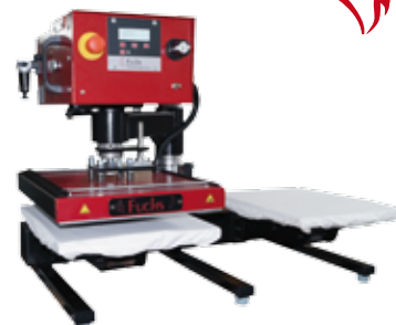
Air-Swing 2000 PRO Membrane

Presse pour T-shirts à double plateaux, pression pneumatique et plateaux à membrane Ft.: 35x45 cm ou 40x50 cm