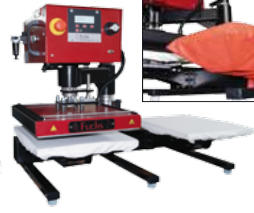
Air-Swing 2000 PRO

Presse pour T-shirts à double plateau et pression pneumatique Ft. : 35x45 cm ou 40x50 cm