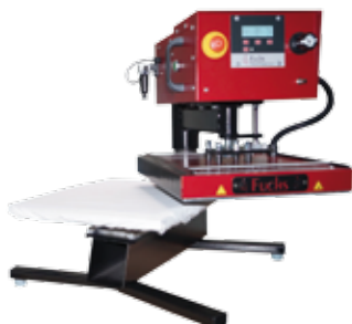
Air-Swing 1000 Membrane

Presse manuelle pour T-shirts avec plateau à membrane Ft.: 35x45 cm ou 40x50 cm