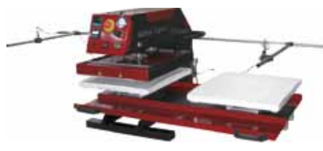
Support AirStar Express