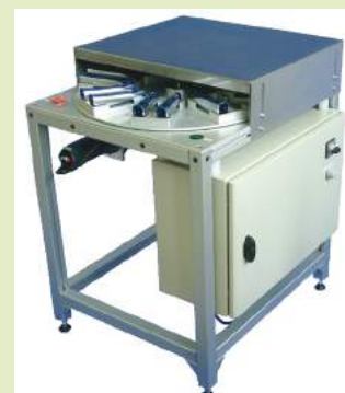
Prétraitement et traitement ultérieur