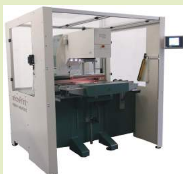
Cellule de sécurité